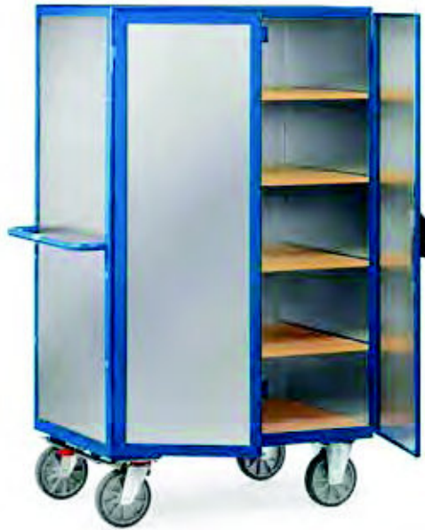
5592 | 5593 Alublech