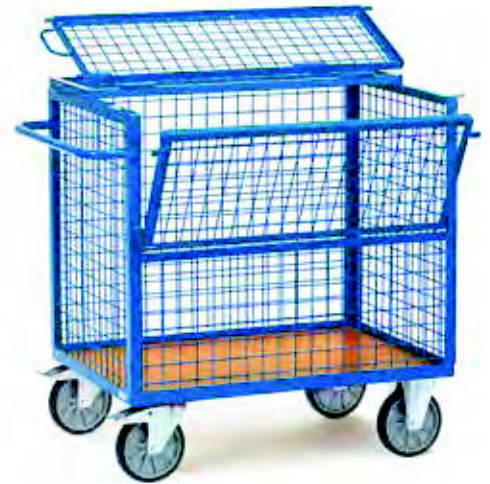
2762 | 2763 Drahtkastenwagen mit Deckel