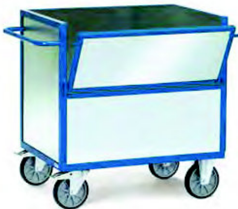
2822 | 2823 Blechkastenwagen