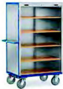
5692 | 5693 geöffnet