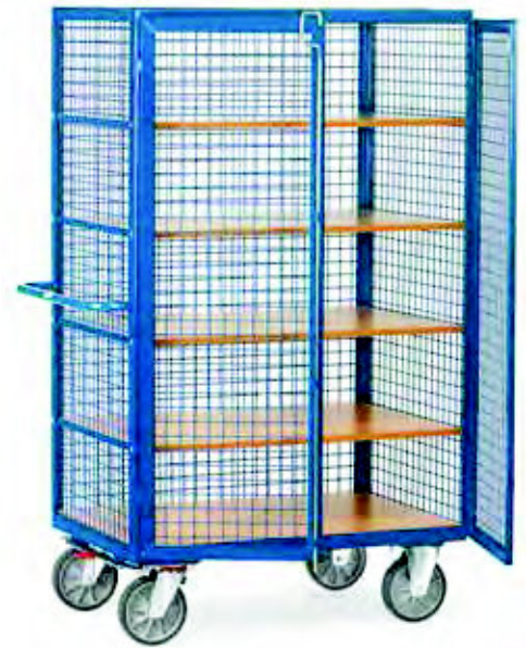
4392 | 4393 Stangenverschluss