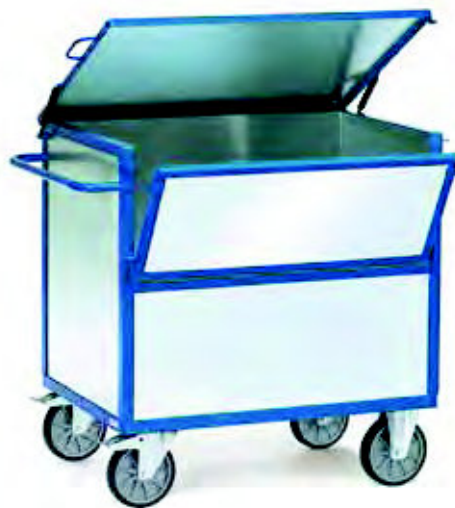
2832 | 2833 Blechkastenwagen mit Deckel