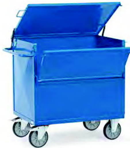
2862 | 2863 Blechkastenwagen mit Deckel