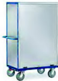
5692 | 5693 geschlossen