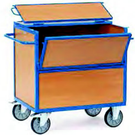
2852 | 2853 Holzkastenwagen mit Deckel