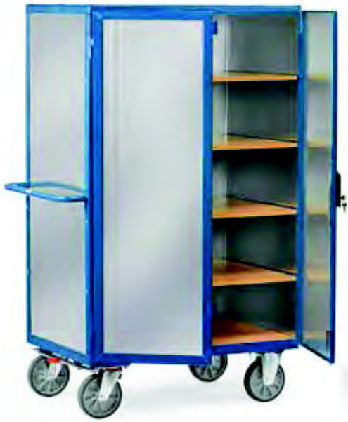
5492 | 5493 Stahlblech verzinkt