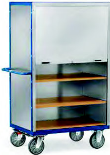
5692 | 5693