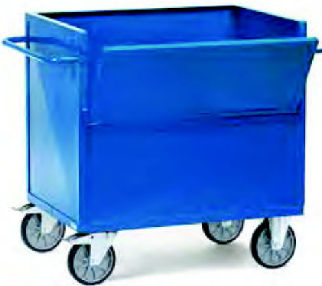
2842 | 2843 Blechkastenwagen

Konstruktion wie 2822 | 2823, jedoch mit einteiligem Deckel wie bei 2862 | 2863.