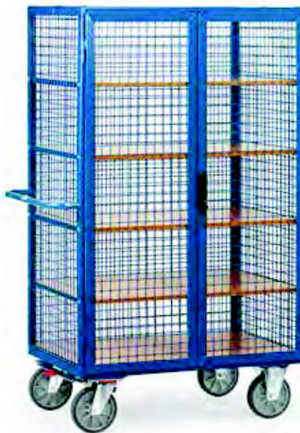
5392 | 5393 Treibriegelverschluss