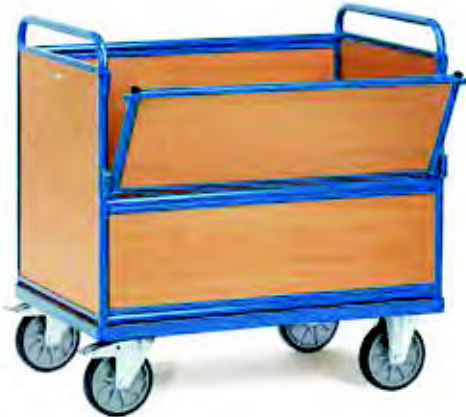
2872 | 2873 Holzkastenwagen