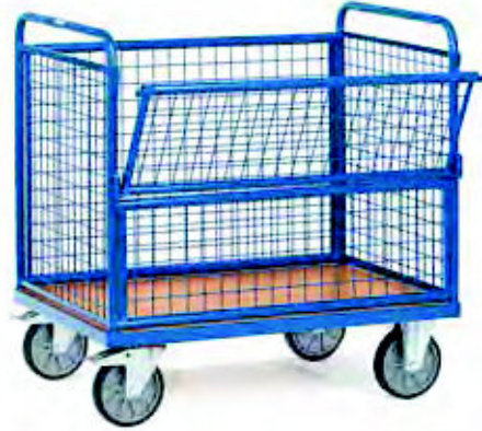
2772 | 2773 Drahtkastenwagen