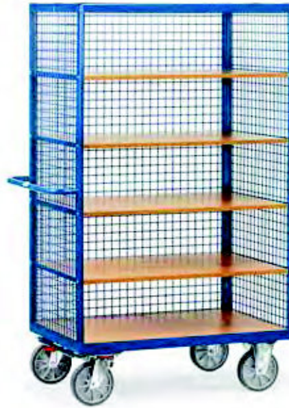
3392 | 3393