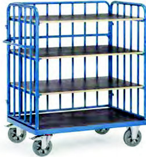
18212-1 | 18213-1