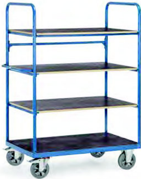
18302 | 18303