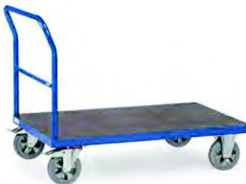
12502 | 12503 | 12505 | 12506