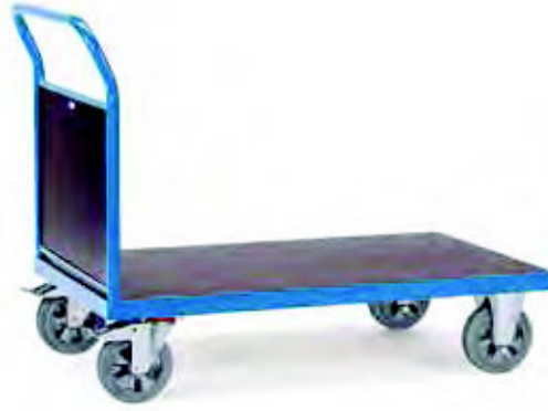
12512 | 12513 | 12515 | 12516

Feststeller an den Lenkrollen, gemäß der Europäischen Norm EN 1757-3 (Sicherheit von Plattformwagen).