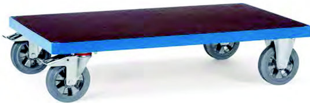
12592 | 12593 | 12595 | 12596