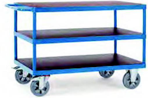
12422 | 12423 | 12425 | 12426