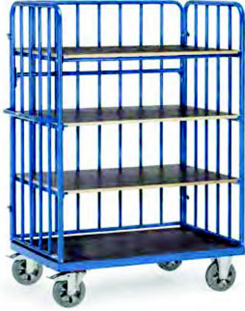
18312-1 | 18313-1