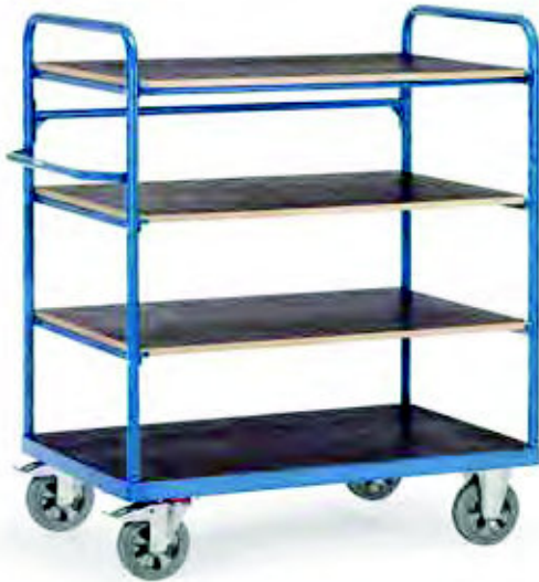
18202 | 18203