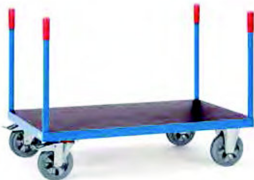
12582 | 12583 | 12585 | 12586