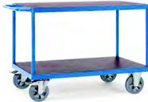
12402 | 12403 | 12405 | 12406