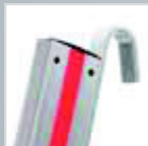
Einhängehaken-Set › Siehe Seite 175.