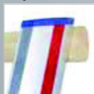
Anlegebrett-Set › Siehe Seite 176.